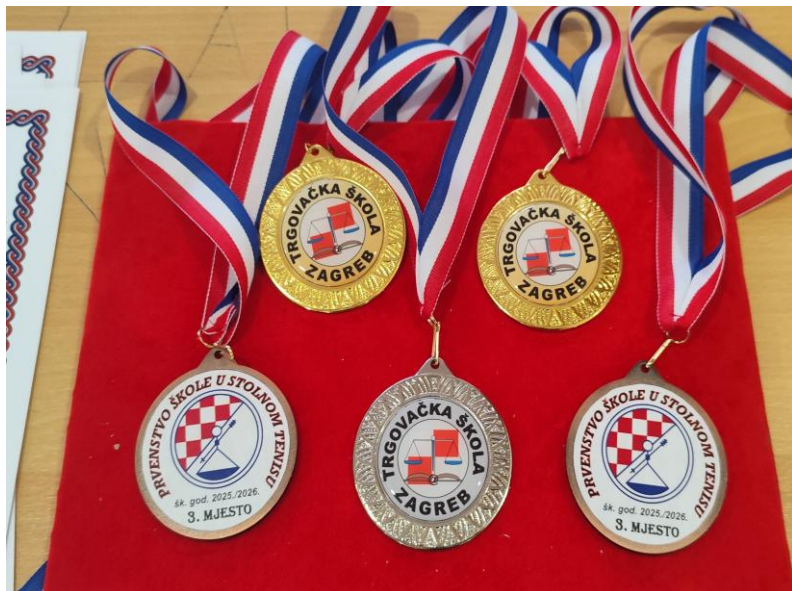
m e d a l j e